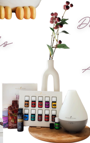
Adobe Mist 35m2