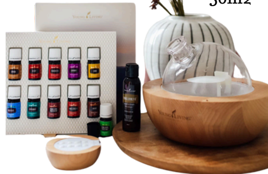
Dew Drop 30m2