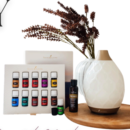
Desert Mist 30m2