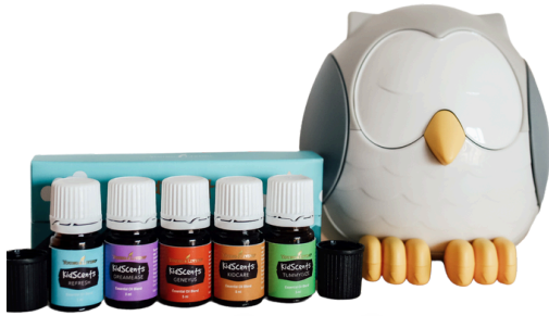
Little Oilers 30m2